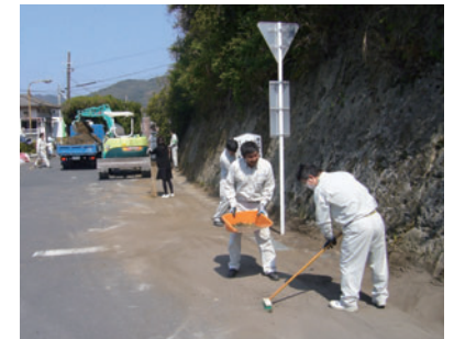
串木野鉱山正門付近の清掃