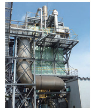
熱風炉の排ガス処理設備