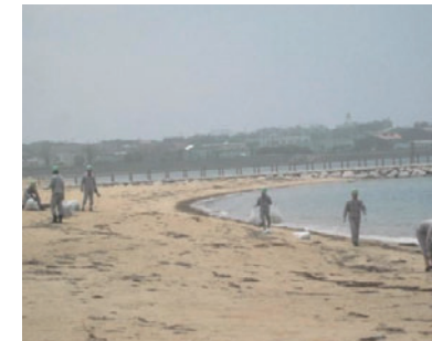
彦島製錬付近の海岸清掃

三井金属グループは、工場周辺の環境美化を重要な地域貢献活動のひとつと考えています。2010年度は竹原製錬所、彦島製錬、串木野鉱山、特殊銅箔(上尾)で清掃活動を実施しました。