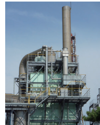
スラグフューミング炉の排ガス処理設備