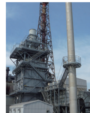
発電所の排ガス処理設備